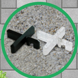
GreenLiner® FKS-10 & FKK-10