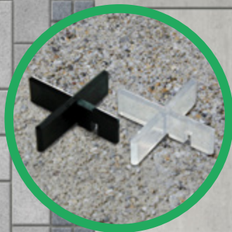
GreenLiner® FKS-5 & FKK-5