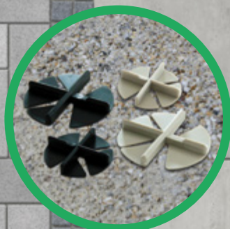
GreenLiner® FKS-3/5-STP & FKG-3/5-STP

Fugenkreuze für exakte und einheitliche Fugenbilder