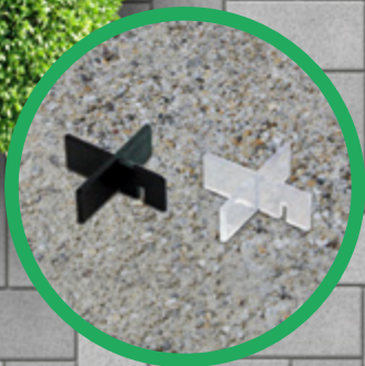
GreenLiner® FKS-3 & FKK-3